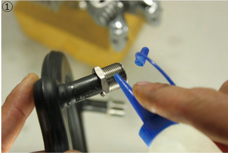
① マフラーナットのネジ部に、潤滑油を注油します。 ①Apply lubricant or oil to the thread of the nuts.