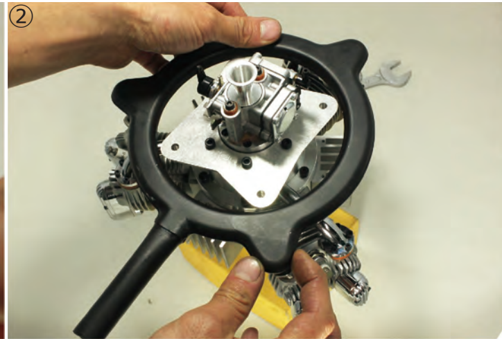
② リングマフラーナットを全てのシリンダーに軽くねじ込みます。3つ全て、指でスムーズに回るように位置を合わせて下さい。無理やりにねじ込むと、シリンダーを破損します。 ②Insert 3 nuts of the ring muffer into each cylinder. Adjust position that all threads can be turned smoothly by your fingers. Never tighten by force, or you may break the cylinders.